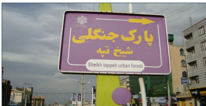
تصویر ۵) نمونه دوزبانۀ فارسی-اروپایی در منطقه الف

در موارد متعدد در یک داده شاهد استفاده از دو متن فارسی و اروپایی (شامل زبان‌های انگلیسی، فرانسه، آلمانی و غیره) هستیم. چنانچه متن فارسی بزرگ‌تر باشد، داده را جزء الگوی دوزبانۀ فارسی-اروپایی به شمار می‌آوریم. برای مثال، در تصویر (۵) عبارت فارسی «پارک جنگلی شیخ تپه» با فونت بزرگ‌تر و مشخص‌تری درج شده و معادل انگلیسی آن Sheikh tappeh urban forest در زیر درج شده است.