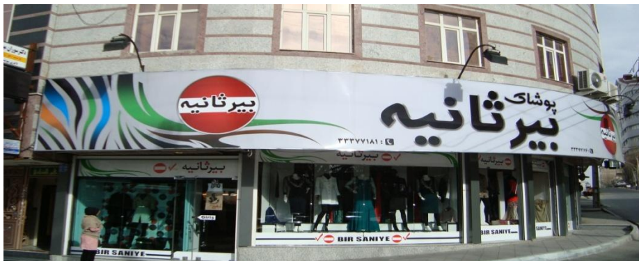
تصویر ۷) نمونه فارسی-ترکی در منطقه الف

از مجموع داده‌های پژوهش (۲۰۴۴ داده) صرفاً ۹ داده در قالب الگوی دوزبانه فارسی-ترکی شناسایی شدند. تصویر زیر نمونه‌ای از این الگو را به نمایش می‌گذارد. در تصویر (۷) بخشی از نام فروشگاه (پوشاک و ثانیه) فارسی است، و واژه ترکی «بیر» به آن افزوده شده است.