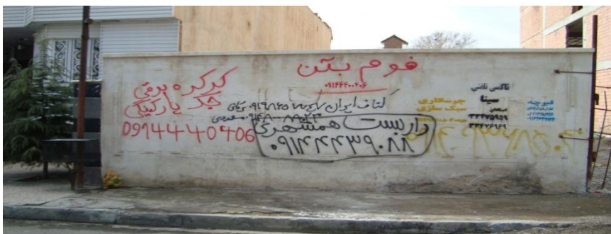
تصویر (۱) هفت دیوارنوشته به عنوان هفت داده زبانی

مانع از انجام کار نمی‌شد. در مواردی برگه‌های چسبیده شده به روی تیرها و دیوارها مخدوش بودند و در این موارد، محققان صرفاً به برگه‌های کامل و خوانا اکتفا کردند. همچنین بسیاری از داده‌های پژوهش از قبیل نام خیابان‌ها و معابر اصلی و فرعی و آگهی ترحیم که به یک رده شغلی خاص اختصاص ندارند در رده شغلی تبلیغات عمومی طبقه‌بندی شدند. در مواردی، تشخیص داده‌ها در کنار هم دشوار بود. برای مثال، در شناسایی متون تصویر زیر، محققان به رنگ دیوارنوشته‌ها نیز توجه کرده‌اند. در تصویر (۱) هفت داده زبانی شناسایی شده است.