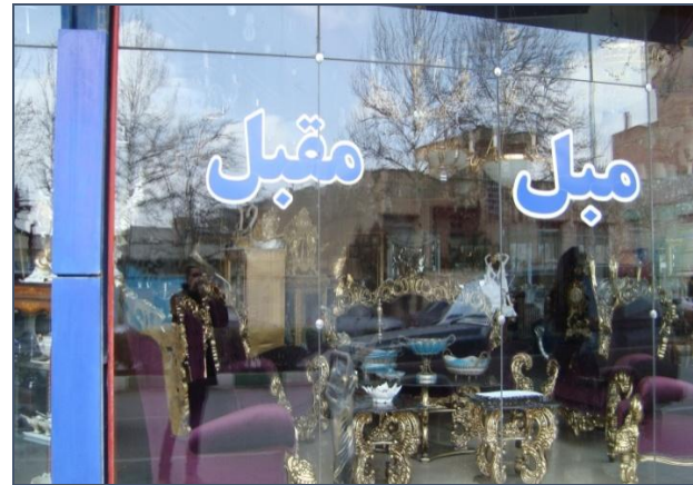
تصویر ۲) نمونه یک‌زبانه فارسی در منطقه الف