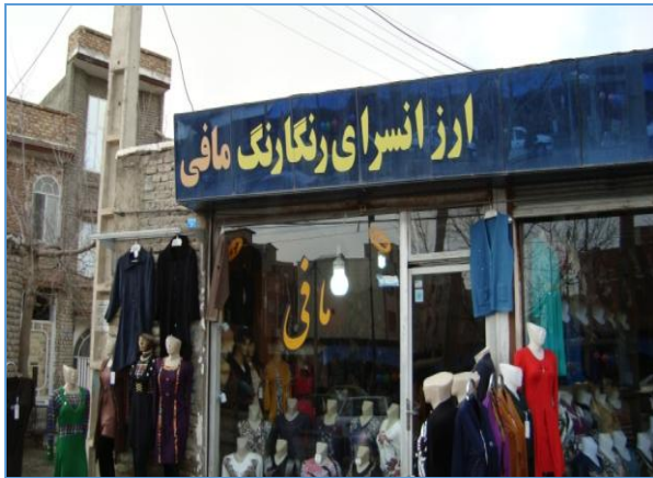
تصویر ۳) نمونه یک‌زبانه فارسی در منطقه ج