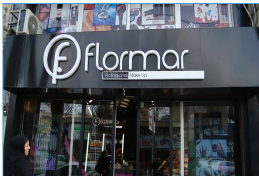
تصویر ۴) نمونه یک‌زبانۀ اروپایی در منطقه ب