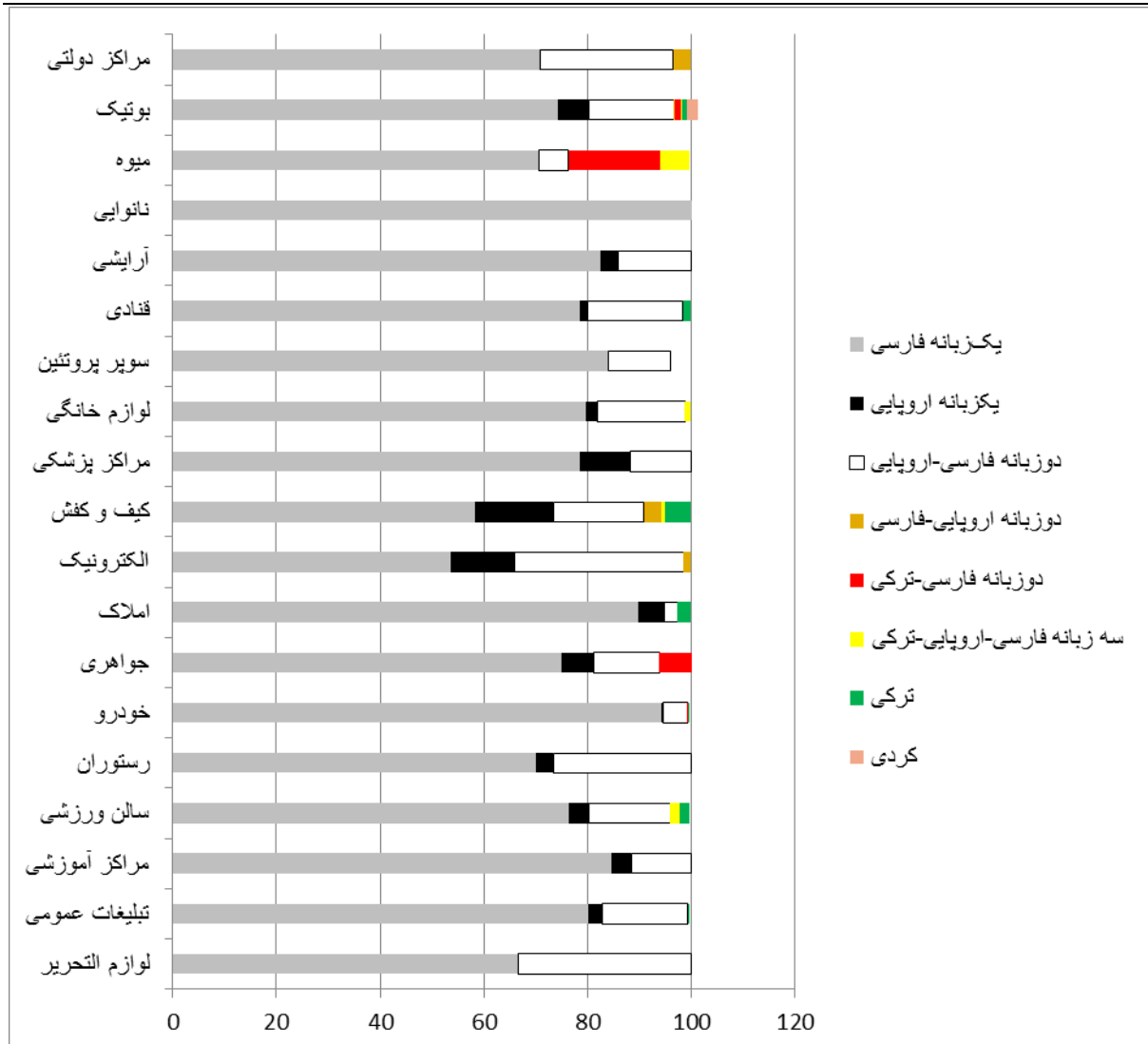
نمودار ۲) درصد استفاده از الگوهای مختلف زبانی به تفکیک رده‌های شغلی

شایان ذکر است که در رده شغلی ۱ شاهد استفاده از الگوی یک‌زبان اروپایی (نوار مشکی‌رنگ) نیستیم. همچنین الگوهای دوزبان فارسی-ترکی، یک‌زبان ترکی و یا یک‌زبان کردی نیز در این رده مشاهده نمی‌شود. رده شغلی ۲ (بوتیک) با تمام رده‌های شغلی دیگر تفاوت دارد؛ زیرا فعالان این صنف از تمام الگوهای زبانی هشت‌گانه (البته با درصد‌های متغیر) استفاده کرده‌اند. رده شغلی ۵ (نانوایی) نیز از این جهت با سایر رده‌ها تفاوت دارد که در آن تنها از یک الگوی زبانی (یک‌زبان فارسی) استفاده شده است. دقت در میله‌های نمودار زیر حاکی از آن است که میان استفاده از الگوهای مختلف زبانی از یک سو، و رده‌های شغلی و صنفی از سوی دیگر ارتباط وجود دارد. بدیهی است تحلیل این تفاوت‌ها به عوامل مختلفی نظیر جامعه هدف یک رده شغلی، کالاها و خدمات ارائه شده در یک رده شغلی، امکان فعالیت به عنوان نمایندگی شرکت‌های خارجی و غیره بستگی دارد.