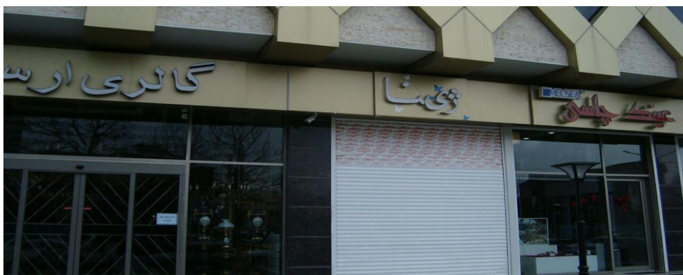
تصویر ۱۰) نمونه‌ی یک‌زبانۀ کردی در منطقه الف

از مجموع داده‌های پژوهش، فقط دو داده به زبان کردی مشاهده شد. همان‌طور که در تصویر (۱۰) مشاهده می‌کنیم، یک واحد صنفی بوتیک (که البته در روزهای انجام پژوهش بسته بود اما به استناد واحدهای همجوار فروشنده پوشاک است) دارای یک نام کردی است. با تکیه بر اظهارات صاحبان واحدهای مجاور همین نام روی شیشه فروشگاه نیز درج شده است و لذا محققان ۲ مورد را برای الگوی یک‌زبانۀ کردی ثبت کرده‌اند.