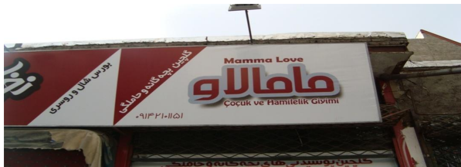
تصویر ۸) نمونه سه‌زبانه فارسی-اروپایی-ترکی در منطقه ج

از مجموع کل داده‌های پژوهش، ۵ داده از الگوی سه‌زبانه فارسی-اروپایی-ترکی بهره گرفته‌اند. در تصویر (۸)، در یک داده زبانی واحد دو عبارت فارسی («گلچین بچه‌گانه و حاملگی» و «بورس شال و روسری»)، عبارت انگلیسی Mamma Love و ترکی ÇuÇuk ve Hamilelik Giyimi درج شده است.