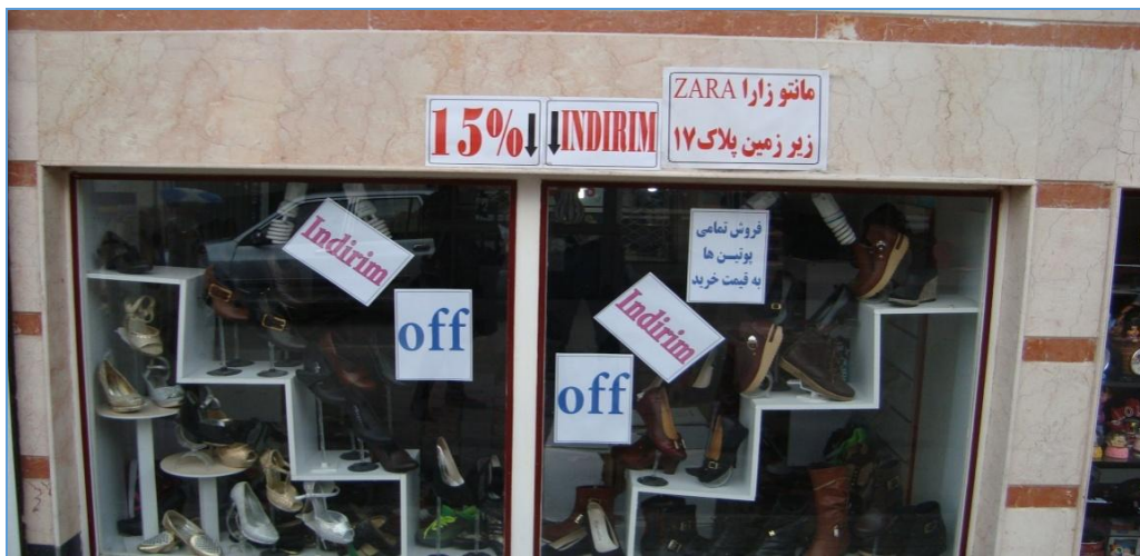
تصویر ۹) نمونه‌هایی از الگوهای یک‌زبانۀ ترکی، یک‌زبانۀ اروپایی، یک‌زبانۀ فارسی و دوزبانۀ فارسی-اروپایی

از مجموع داده‌های پژوهش حاضر، ۱۵ داده از الگوی یک‌زبانۀ ترکی (ترکی آذری یا استانبولی) با الفبای فارسی یا لاتین استفاده کرده‌اند. برای مثال، در تصویر (۹)، هشت داده‌ی زبانی به چشم می‌خورد. سه داده شامل واژه ترکی Indirim (به معنای تخفیف) با الفبای لاتین به الگوی یک‌زبانۀ ترکی تعلق دارد. دو داده شامل واژه Off از الگوی یک‌زبانۀ اروپایی استفاده کرده‌اند. داده «مانتو زارا ZARA زیرزمین پلاک ۱۷» دوزبانۀ فارسی-لاتین است و داده «فروش تمامی پوتین‌ها به قیمت خرید» نیز به الگوی یک‌زبانۀ فارسی تعلق دارد. داده‌ای که عدد ۱۵٪ را نمایش می‌دهد نیز به عنوان یک داده‌ی یک‌زبانۀ اروپایی شناسایی شده است.