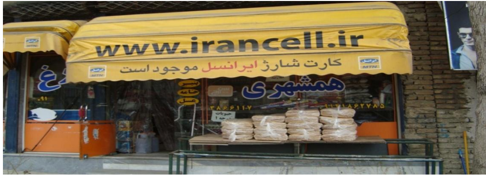
تصویر ۶) نمونه دوزبانه اروپایی-فارسی در منطقه ج