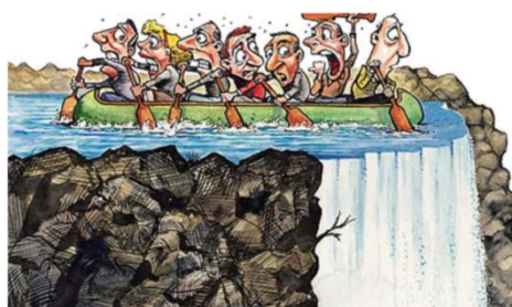
شکل ۱- زمان برای تصمیم‌گیری

گفتاری و فرایند‌های ذهنی و ت) رخدادها ۱ (کرس و ون‌لیوون، ۲۰۰۶: ۵۹). شکل (۱) نمونه‌ای از فرایند کنشی را نشان می‌دهد می‌دهد که «در آن هفت نفر در قایقی نشسته‌اند و پشت سر آنها آبشاری خطرناک قرار دارد و آنها سعی می‌کنند با حداکثر توان برخلاف جهت آبشار پارو بزنند. چهار نفر آنها با امیدواری پارو می‌زنند و گویی مطمئن‌اند که از آبشار خلاص خواهند شد؛ اما سه نفر دیگر به نظر می‌رسد عصبی‌تر و نگران‌ترند» (ینگ و ژنگ، ۲۰۱۴: ۲۵۶۶). در تصویر مذکور، شش نفر کنش‌گرند. پاروی آنها مانند بُردار عمل می‌کند که خطوطی مورب با جریان رودخانه (هدف) می‌سازد. «این فرایند کنشی، انجام‌شدنی است. علاوه بر آن، فرایند کنشی دیگری نیز مطرح است که با آبشاری بیان می‌شود که به پایین می‌ریزد. فرایند مذکور، انجام‌شدنی است؛ به عبارت دیگر، افراد یا اشیائی در آن دخالت ندارند و هدفی نیز نیست» (ینگ و ژنگ، ۲۰۱۴: ۲۵۶۶). متن زبانی شکل (۱) نیز از شکست استراتژی اروپایی صحبت می‌کند و بیان می‌کند «کشورهای اروپایی لازم است تمهیداتی بیشتر بیندیشند تا از بحران مالی خلاص شوند. هفت نفر در واقع هفت کشور اروپایی پرتغال، بلژیک، اسپانیا، یونان، ایرلند، ایتالیا و آلمان‌اند که هنوز فرصت دارند با تلاش بیشتر از بحران خلاصی یابند و آبشار نیز همان بحران مالی است» (ینگ و ژنگ، ۲۰۱۴: ۲۵۶۶). اگر این کشورها تصمیمات فوری و جدی نگیرند، از بین خواهند رفت.