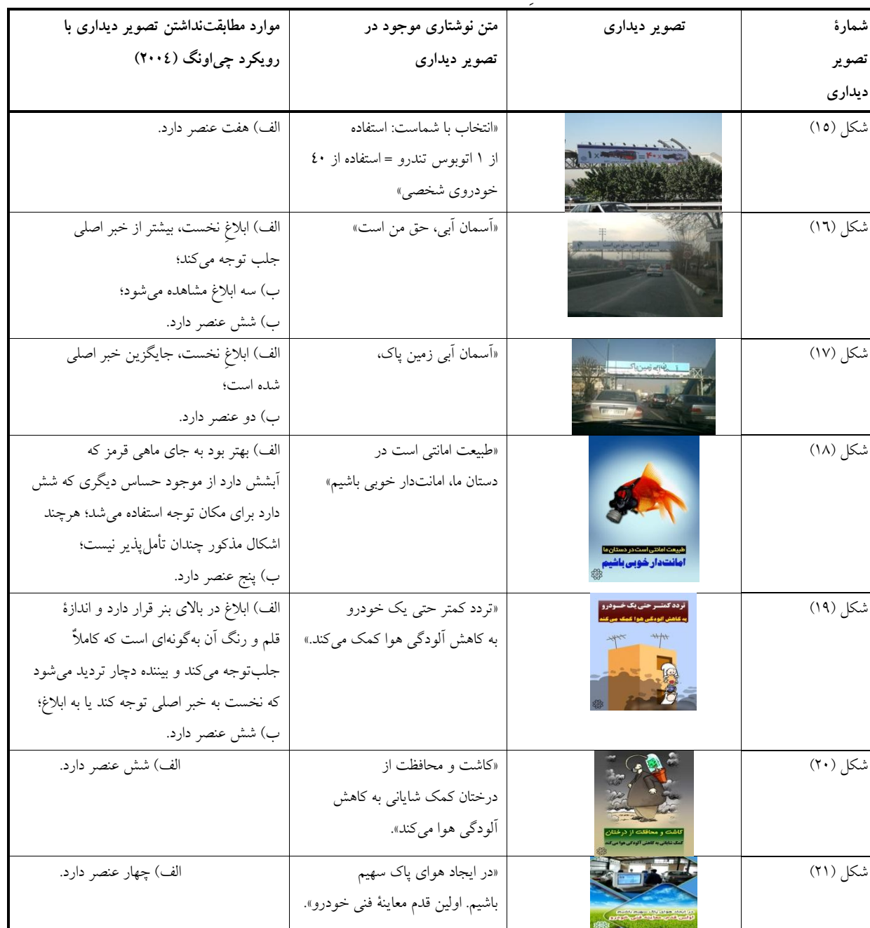
جدول ۲- خلاصه تحلیل مابقی تصویرهای دیداری مربوط به آلودگی هوا

شده است (جدول (۲)، شکل (۱۶)). در این مورد نیز علاوه بر تعدد ابلاغ‌ها، شاید یکنواخت بودن رنگ قلم باعث خسته شدن بیننده شود و خوانش تصویر دیداری را نصفه‌کاره رها کند. گاهی ابلاغ در بالای بنر قرار داشت و اندازه قلم و رنگ آن به گونه‌ای بود که کاملاً جلب توجه می‌کرد و بیننده دچار تردید می‌شد که نخست، به خبر اصلی توجه کند یا به ابلاغ (شکل (۱۹)). در مواردی نیز بخش‌هایی از خبر اصلی با یکدیگر همخوانی نداشتند (جدول (۲)، شکل (۷))؛ یعنی به جای آنکه در توضیح تکمیلی هم باشند، اطلاعات غیرمرتبط ارائه می‌دادند. یافته‌های اخیر نیز در راستای رویکرد چی‌اونگ نیست و لازم است تغییرات لازم طبق رویکرد مذکور اعمال شود تا درک آگهی برای بیننده سهل‌تر باشد.